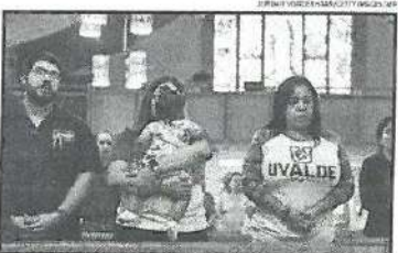
Moradores da região compareceram à Igreja Sagrada Coração, em Uvalde, para rezar pelas vítimas de escola local